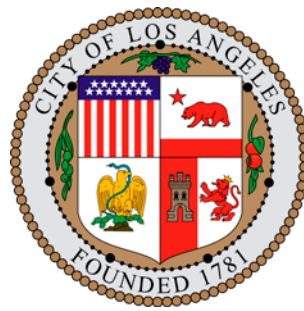
Sello oficial de la ciudad de Los Ángeles

El sello oficial de la ciudad de Los Ángeles guarda una estrecha vinculación con su legado hispano y también es el elemento central de la bandera de la ciudad. Este símbolo fue diseñado por Herbert L. Goudge, un asistente del fiscal de la ciudad, y adoptado oficialmente el 27 de marzo de 1905.