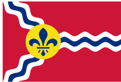
Bandera de St. Louis

La bandera de St. Louis es una de las más curiosas de Estados Unidos por su diseño y colorido, y en ella también podemos encontrar referencias a la presencia española en la ciudad. Fue adoptada formalmente el 3 de febrero de 1964 y la diseñó Theodore Sizer, profesor de arte de Yale y miembro del comité que el alcalde escogió para su rediseño con motivo del bicentenario de la ciudad.