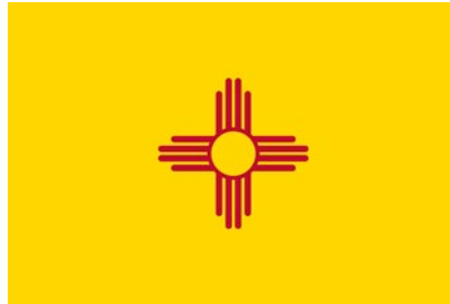
Bandera de Nuevo México

El historiador Ralph Emerson Twitchell diseñó la primera bandera del estado de Nuevo México en 1915 , la cual no tenía ninguna referencia a la influencia española en el territorio salvo por el propio nombre del estado.