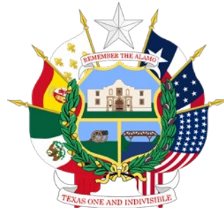
Reverso del sello estatal de Texas