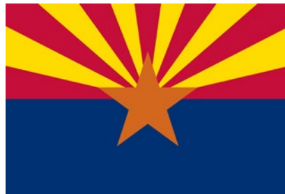
Bandera de Arizona

Según las fuentes oficiales del estado de Arizona su bandera representa “la estrella de cobre de Arizona que se levanta de un campo azul frente a un sol poniente” . Sin embargo, si analizamos más en detalle el contenido de este emblema podemos apreciar también el legado español en él.