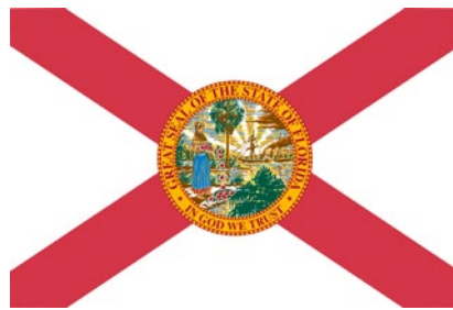
Bandera de Florida

El diseño actual de la bandera de Florida se adoptó en el año 1900. Los habitantes del estado ratificaron una enmienda para agregar barras rojas diagonales en la forma de una cruz de San Andrés a la bandera , puesto que antes solo contaba con el sello del estado en un fondo blanco.