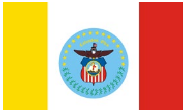
Bandera de Columbus