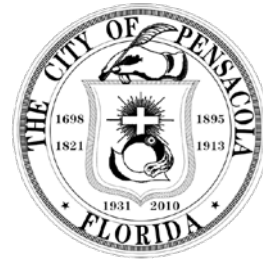
Sello de la ciudad de Pensacola

Esta ciudad también es conocida como “La Ciudad de las Cinco Banderas” . Este apodo se debe a que cinco países diferentes tuvieron control sobre la localidad a lo largo de su historia. Desde que el explorador español Don Tristán de Luna plantó por primera vez la bandera con las enseñas de Castilla y León en las costas de la ciudad en 1559, los residentes de Pensacola han vivido bajo cinco enseñas distintas: la española, la francesa, la británica, la confederada y la de los Estados Unidos de América . La bandera actual por su parte muestra este legado mediante una combinación del resto.