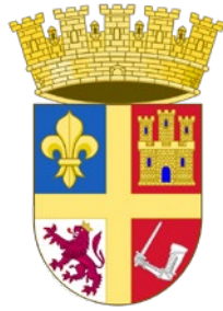
Escudo de Armas de San Agustín

Al hablar de la presencia española en los símbolos de Estados Unidos es imprescindible mencionar San Agustín, ciudad fundada por Pedro Menéndez de Avilés en 1565 y que sigue siendo la ciudad habitada sin interrupción más antigua del país. Sus símbolos, especialmente su escudo de armas, nos muestran su inconfundible herencia española que hoy permanece más viva que nunca.