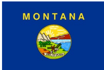
Bandera del estado de Montana