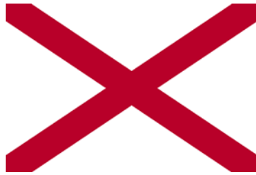
Bandera de Alabama