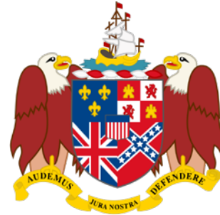
Escudo de Armas de Alabama

La actual bandera del estado de Alabama fue aprobada el 16 de febrero de 1895 . En esta ocasión, los ciudadanos del estado designaron que la insignia debía ser de la siguiente forma: “una cruz de San Andrés carmesí en un campo blanco”.