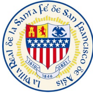
Sello oficial de la ciudad de Santa Fe

Santa Fe es la capital del estado de Nuevo México y tanto su sello como su bandera tienen vinculación con el legado español de la ciudad. De hecho, la insignia de la localidad lleva en el centro el sello de esta, que es el símbolo que cuenta con los principales elementos que revelan la presencia de España en ella.