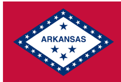
Bandera de Arkansas

La historia de Arkansas ha estado unida a la de España prácticamente desde los inicios de la presencia española en lo que es hoy Estados Unidos. Se estima que el primer europeo que recorrió esas tierras fue Hernando de Soto, lugarteniente de Francisco Pizarro en el Perú. Su expedición, que comenzó en 1539, fue infructuosa en términos de hallazgo de riquezas o establecimiento de asentamientos, pero recorrió y alumbró una enorme porción de la geografía norteamericana, además de descubrir el río Mississippi.